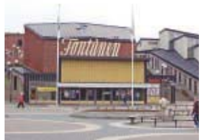
Biograf Fontänen ritades av Sven Backström och Leif Reinius.

Tillskotten måste också hålla samma höga kvalitet som de ursprungliga byggnaderna. Det ombyggda Vällingby Centrum beräknas stå klart 2005–2007.