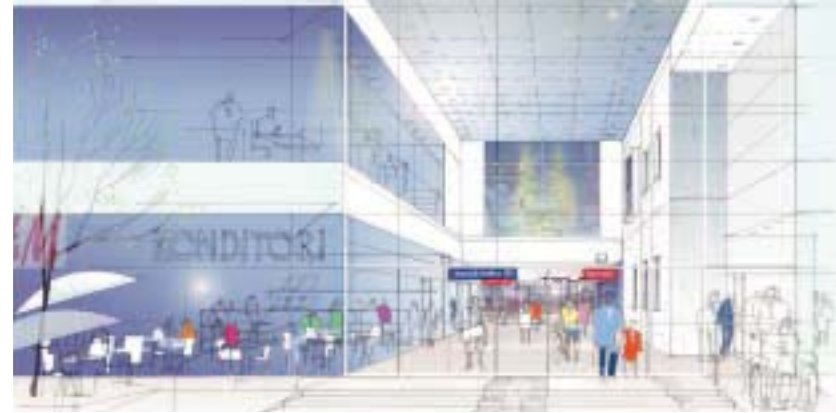
Entré till Forum Nacka.